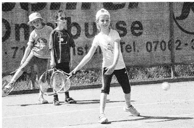
Tenniskinder beim Training