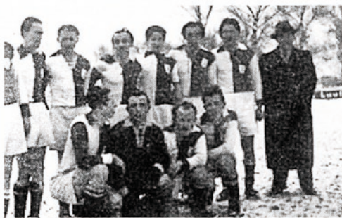
Februar 1952 TSV Auenstein wird Kreispokalsieger