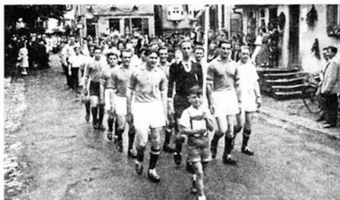
1956 Die Fußballspieler des TSV beteiligen sich am Festumzug durch Auenstein anlässlich des 100-jährigen Jubiläums der Liederkranz Auenstein.

Nur wenige Jahre hielten es die Auensteiner Sportler ohne einen Verein aus. Es war ein Unding. Man musste entweder alleine Sport treiben oder man musste sich außerhalb der Gemeinde einem Verein anschließen. Doch die Auensteiner waren und sind ein sehr heimatverbundenes Volk. Immer mehr Sportler forderten wieder eine geordnete Gemeinschaft. So war es nicht verwunderlich, dass am 15. Juli 1963 der SSV Auenstein von sportbegeisterten Männern aus der Taufe gehoben wurde. 15 Jahre lang spielte man im SSV nur Fußball. Nach der Fertigstellung der Schlossberghalle im Jahre 1978 wurden zunächst weitere vier Abteilungen gegründet. Tischtennis, Kinderturnen, Jedermann- und Frauengymnastik waren geboren. Wiederum sieben Jahre später wurden die Tennisplätze eingeweiht und der SSV um die Tennisabteilung bereichert.